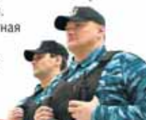
График разный! Тариф от 100 до 130 рублей час. Можно вахтовым методом, жилье предоставляем, оплачиваем проезд если вахта от 2х месяцев. Подработка приветствуется. Полный соц. пакет, заработная плата всегда вовремя. Требования: удостоверение 4-6 разряда обязательно!

В г. Сургут, пгт. Белый Яр, пгт. Солнечный, пгт. Барство, г. Нефтеюганск, Нефтеюганский район, г. Нижневартовск, Нижневартовский район, г. Нягань, г. Мегион, г. Ханты-Мансийск, г. Ногалым, г. Лангепас, г. Урай, г. Югорск.