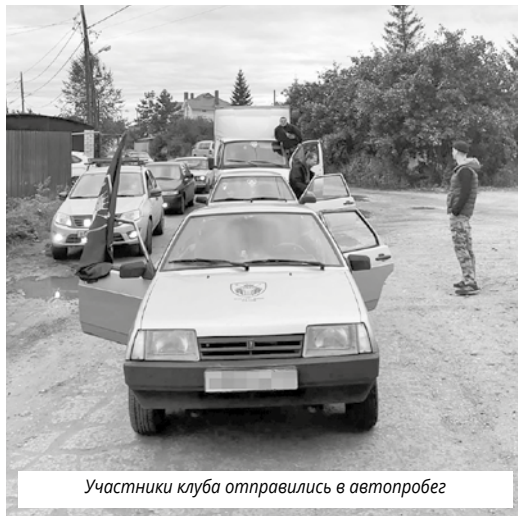
Участники клуба отправились в автопробег