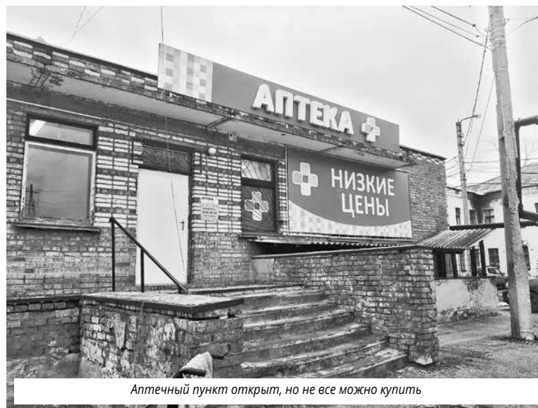
Аптечный пункт открыт, но не все можно купить

карственных препаратов. Продаваться будут только готовые препараты, включая рецептурные.