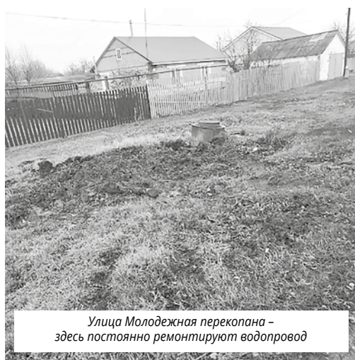
Улица Молодежная перекопана - здесь постоянно ремонтируют водопровод