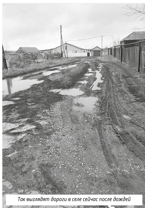
Так выглядят дороги в селе сейчас после дождей

«Я увидела, что «Вестник» стал писать о проблемах Кинель-Черкасского района и решила обратиться с тем, что наболело у нас, - рассказала она. - В нашем селе живет около 600 человек. Это и семьи с детьми, и пожилые люди. Раньше из Репьевки ходили автобусы в Кинель-Черкассы, Самару, в Отрадный. А несколько лет назад их не стало. Нам сказали, что нерентабельно. Но ведь люди тут живут».