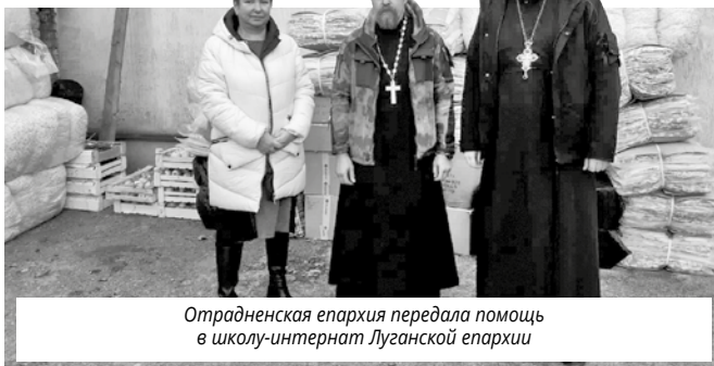
Отрадненская епархия передала помощь в школу-интернат Луганской епархии

А наши воины больше всего рады письмам, присланных им детьми».