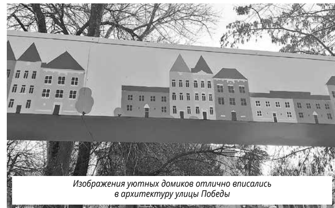
Изображения уютных домиков отлично вписались в архитектуру улицы Победы

У часток воздушной теплотрассы на ул. Победы в Отрадном до неузнаваемости преобразился: его обшили металлическим профилем, а художники из Самары украсили всю поверхность обшивки рисунками. В таком виде теплосети на благоустроенном участке улицы – с новыми дорожками и скамейками – смотрятся намного привлекательней.