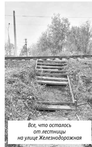
Все, что осталось от лестницы на улице Железнодорожная

В настоящее время отраденцы, работающие в промзоне, с трудом перебираются по полуразрушенным ступеням лестницы через железнодорожные пути на улице Железнодорожной. Им приходится идти на работу с риском получить травмы. А это кратчайший путь на производство и с него.