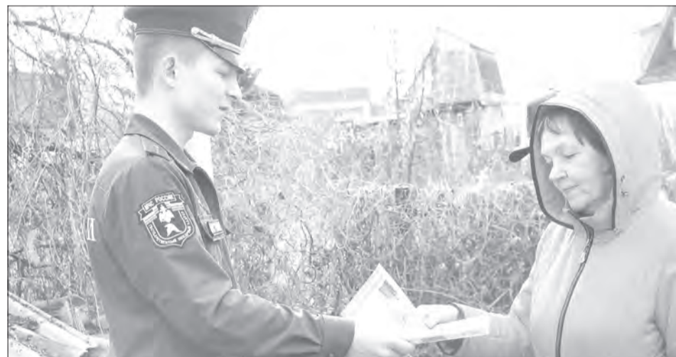
Работа с населением и дачниками заключается в раздаче листовок и разъяснительных беседах

В прошлом году благодаря слаженной работе на территории муниципалитета обошлось без эксцессов. Как будет нынче, покажет время. В любом случае от селян ждут понимания, соблюдения всех требований и своевременных сообщений, если где-то замечено возгорание. Поселения и дачные участки по-прежнему под контролем оперативных групп, а природные объекты - под присмотром лесничеств и авиабазы.