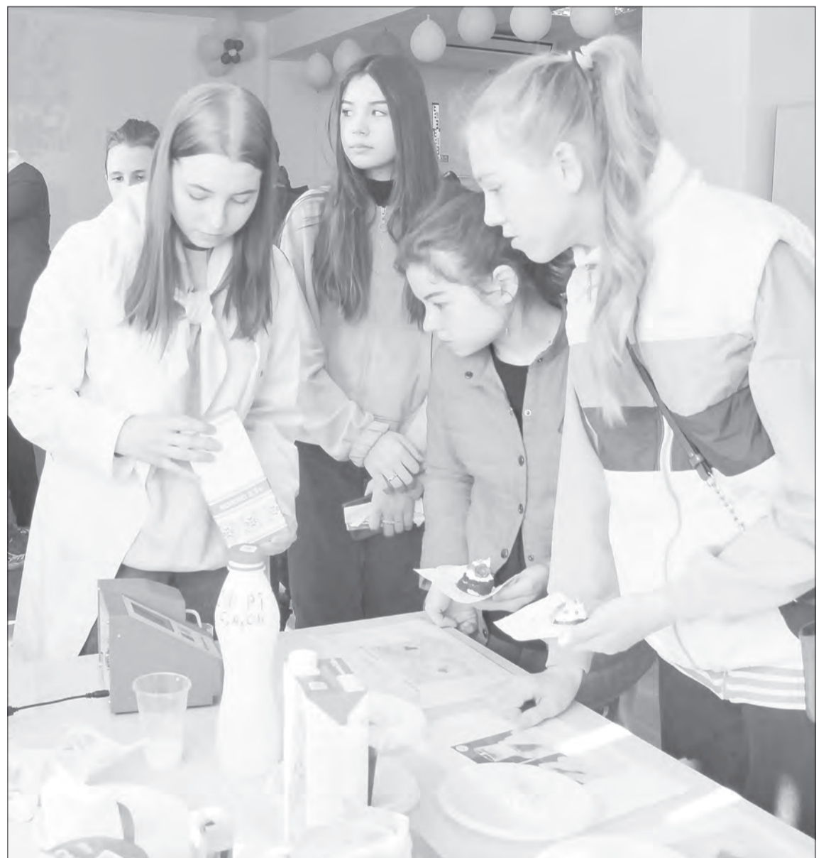
Четверокурсницы – технологи производства и переработки сельхозпродукции – охотно и без запинок тестировали молоко на качество