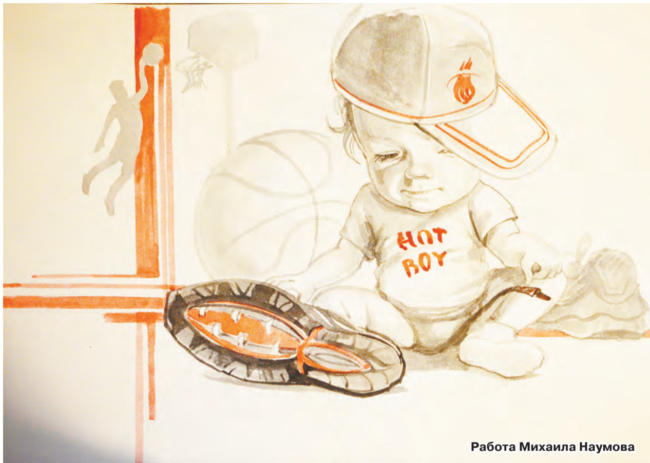
Работа Михаила Наумова