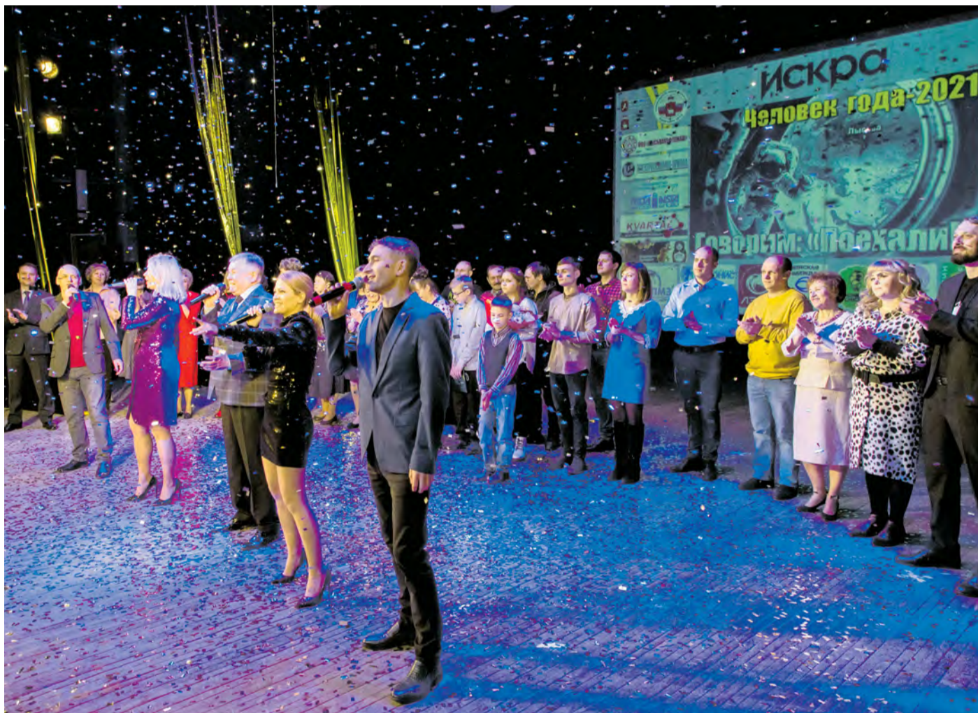
Финальный аккорд праздника.

Регалии и подарки вручены победителям на сцене культурно-делового центра