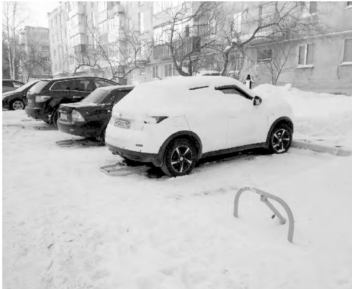
■ Установка на парковках специальных приспособлений помогает избежать конфликтов.

Согласно жилищному кодексу РФ (ст. 36) собственникам помещений в МКД на праве общей долевой собственности принадлежит общее имущество в доме. В том числе и земельный участок, на котором расположе-