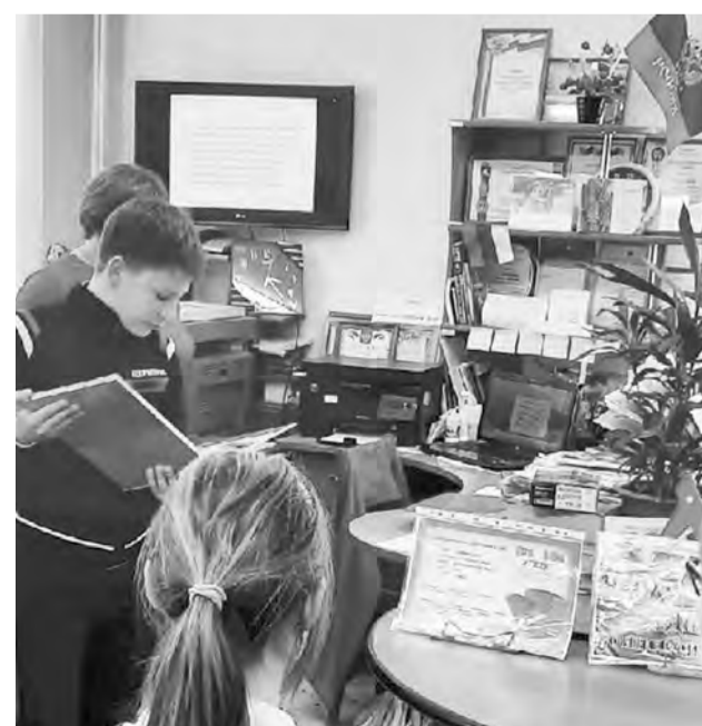
Ребята с интересом листали альбом.