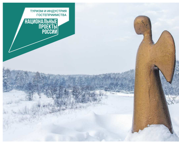
С каждым годом туристические маршруты по родному краю становятся все популярнее

День памяти о россиянах, исполнявших служебный долг за пределами Отечества