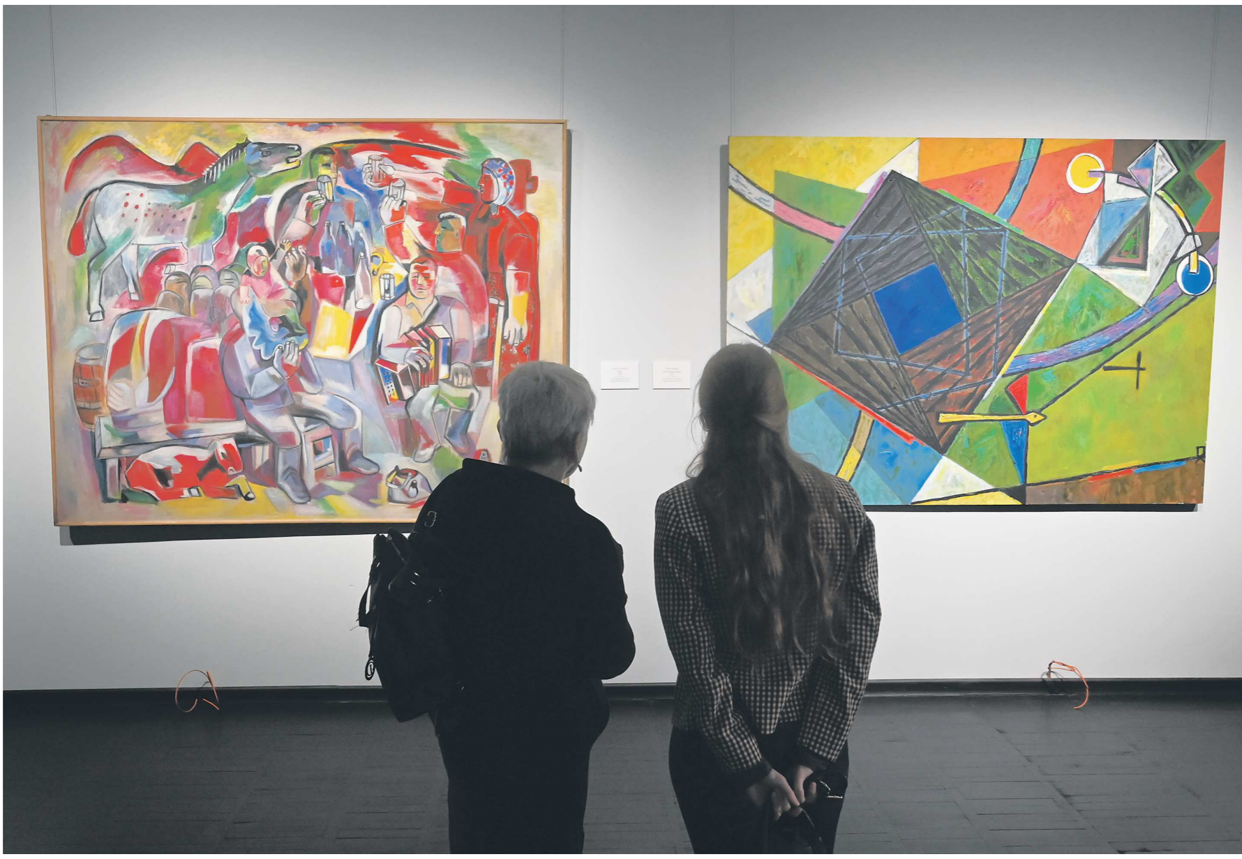
Работы Павла Ходаева и Михаила Назарова с выставки «Земля, небо и их обитатели». Она станет первой для обновленного Большого выставочного зала и для посетителей откроется 10 марта

Часть отведут под вспомогательный музейный лек-