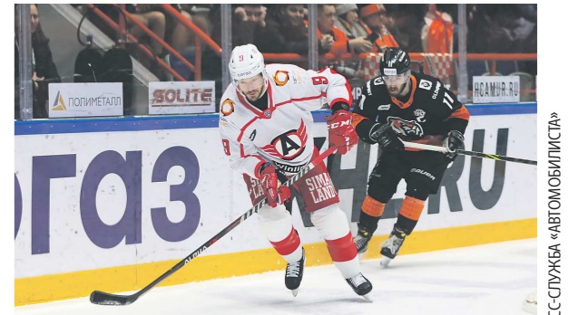
«Автомобилист» впервые в сезоне уступил «Амуру»

Хоккейный клуб «Автомобилист» потерпел поражение в очередном матче регулярного чемпионата КХЛ. «Шоферы» в Хабаровске уступили «Амуру» – 2:3.