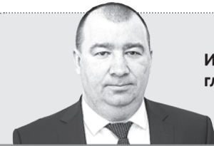
Иван СОЛОМИН, глава городского округа Верхняя Пышма