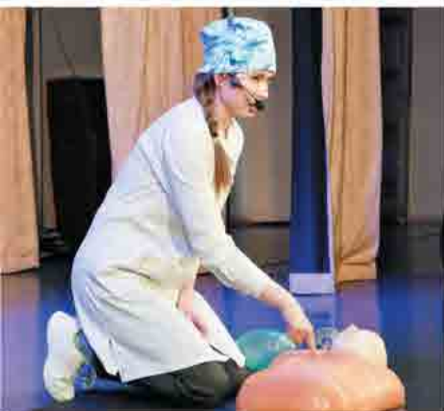
Студентка медицинского колледжа показала, как оказать помощь человеку без сознания.

Желающие обучаться в Алапаевском филиале Свердловского областного медицинского колледжа или в Уральской государственной медицинской академии по целевому направлению могут обратиться в отдел кадров Режевской ЦРБ в будние дни с 8.00 до 16.30 час. (в пятницу до 16.00 час.), обед с 12.00 до 12.30 час., тел. 3-04-40.