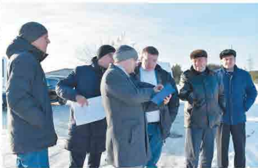
Будущая поликлиника появится вблизи от Режевского многопрофильного техникума.