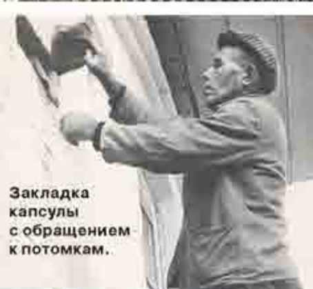
Закладка капсулы с обращением к потомкам.