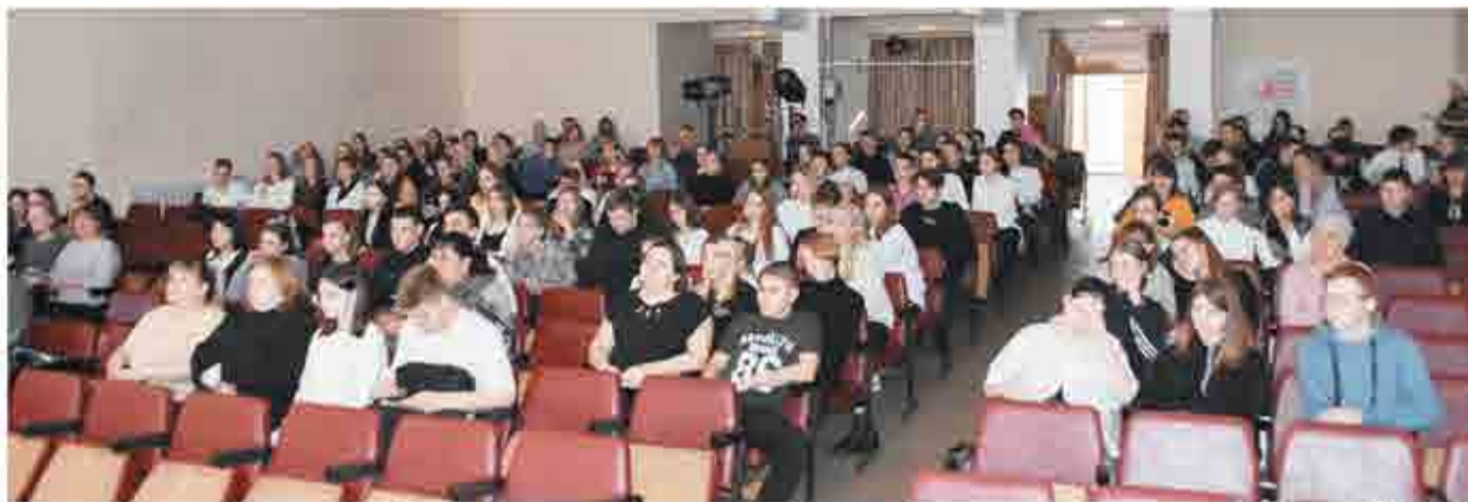
Ознакомиться с условиями обучения по целевому направлению собрались обучающиеся всех школ РГО.