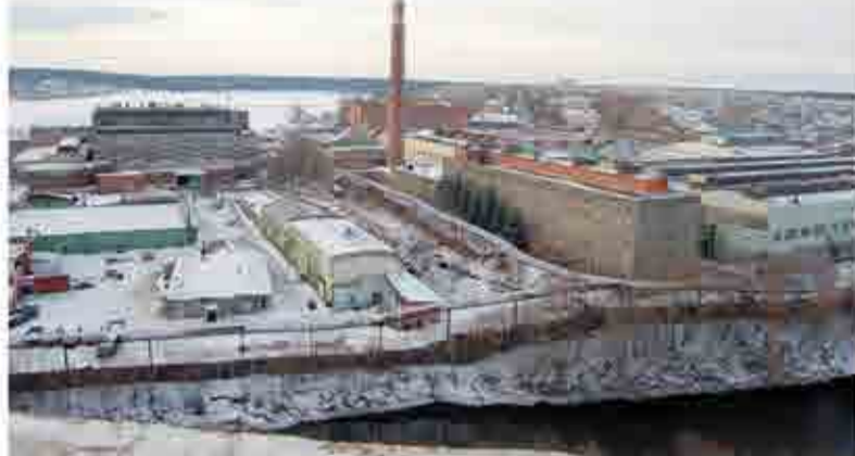
Механический завод. Вид с Орловой горы.