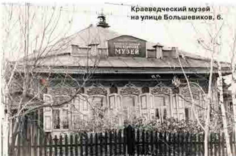
Краеведческий музей на улице Большевиков, 6.

К юбилею Режа в городе хотели открыть краеведческий музей. Все жители Режа принимали активное участие в сборе экспонатов. Было выделено помещение для будущего музея – это дом на улице Большевиков, 6, и даже установлена вывеска. Это запечатлел на фотоснимке местный фотограф Василий Трифонович