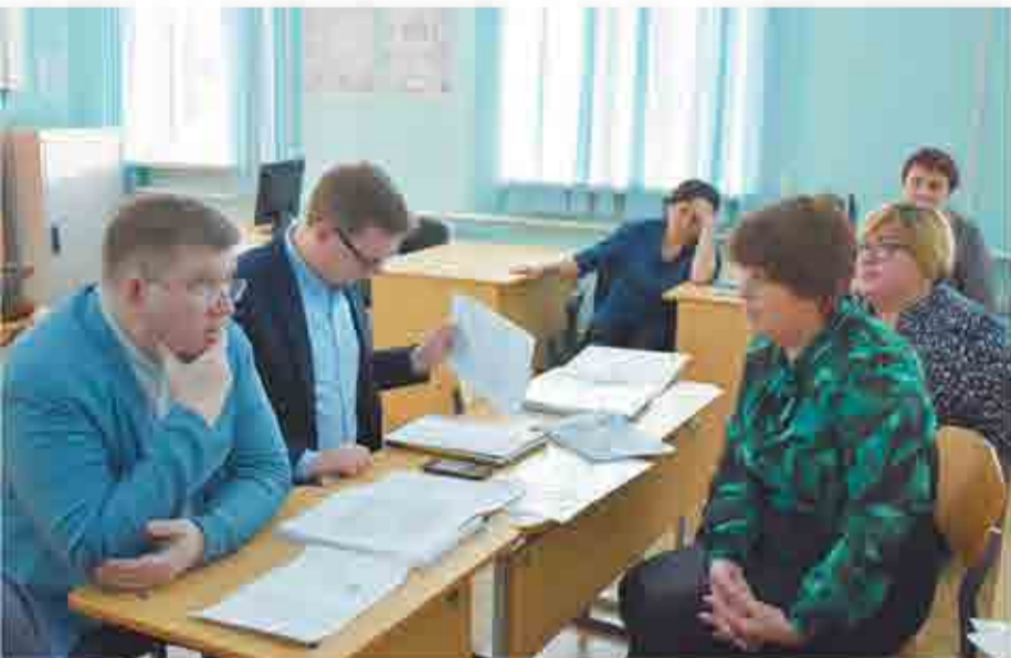
Проект школы-сада в Арамашке обсуждали коллективно.