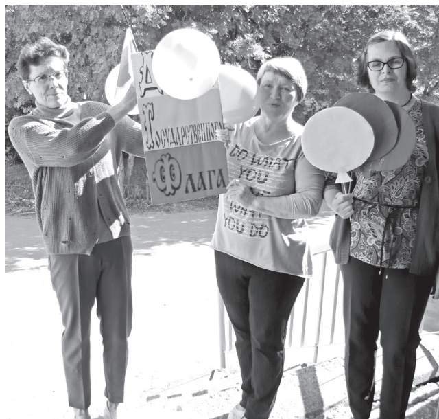
Коллектив ЦДБ участвует в акции «Взвейся в небо, флаг России!»

Н. БАРАНОВА, зав. сектором библиотеки им. С.Я. Маршак