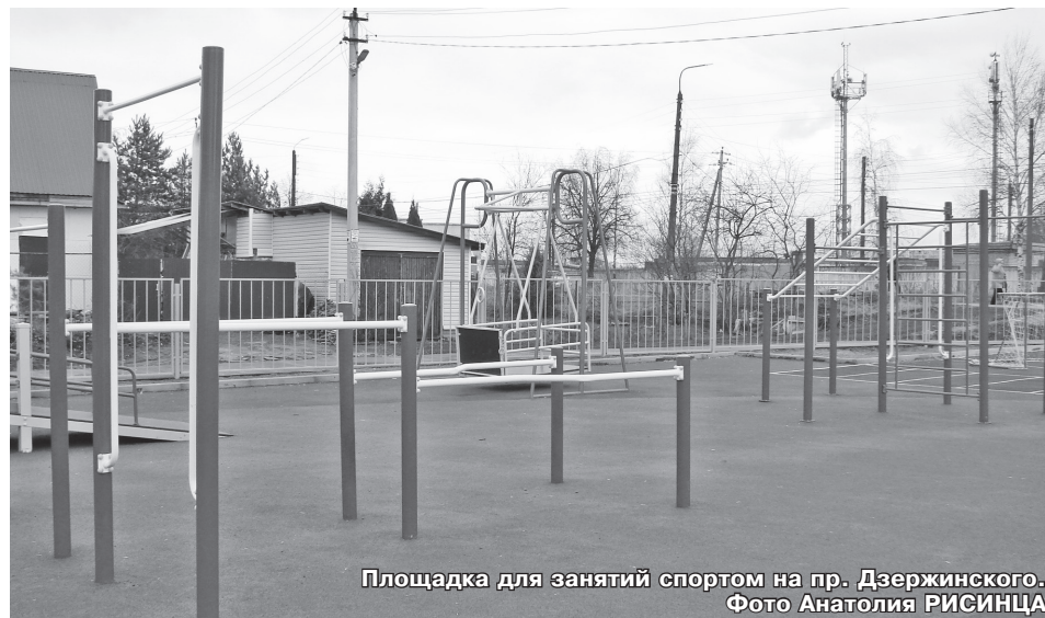
Площадка для занятий спортом на пр. Дзержинского.

«Реализация проекта позволит сделать занятия физкультурой доступными