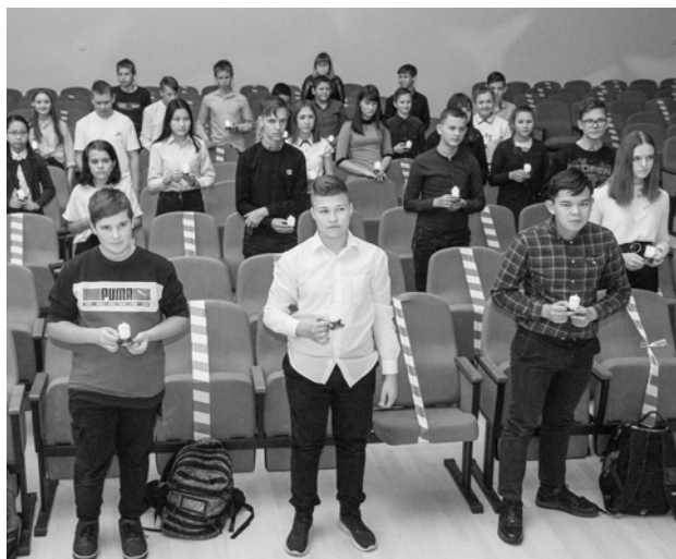
В рамках акции «Огни памяти» восьмиклассники зажгли свечи и почтили всех неизвестных солдат минутой молчания.