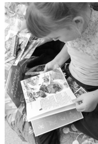
Еще одно доброе дело в копилке специалистов ишимского Управления Пенсионного фонда. А главная награда – счастливые улыбки маленьких пациентов, рассматривающих «сокровища» «Коробки храбрости».

В роли добрых волшебников выступили сотрудники Управления Пенсионного фонда в Ишиме.