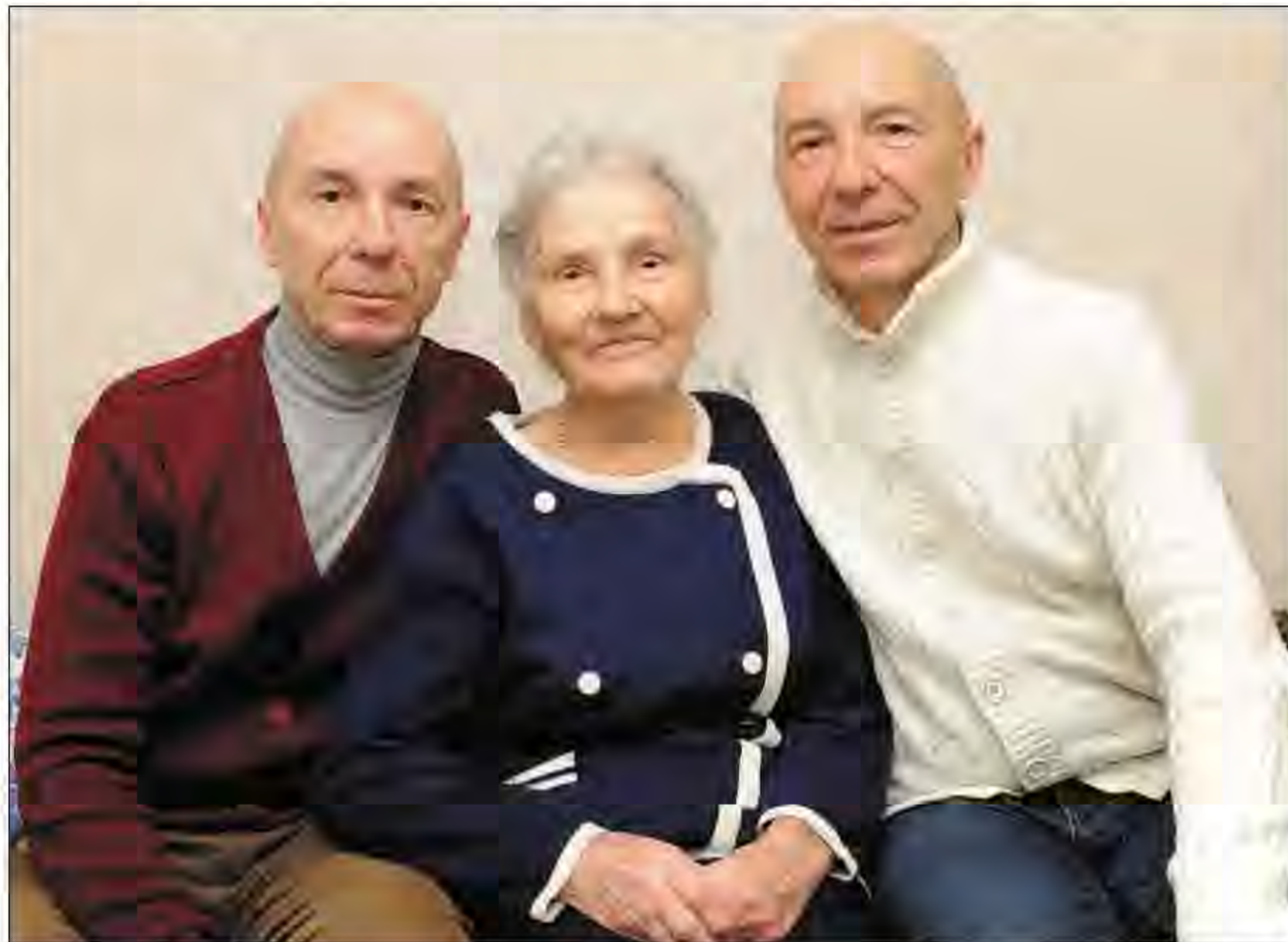
Два сына, два крыла...

Отец, заслуженный учитель РСФСР, преподавал техническое устройство автомобилей в ДОСААФ. Мама работала кассиром-бухгалтером в доме техники "Юбилейный". Здесь же Игорь с Костей занимались в цирковой студии. А ещё были солистами школьного хора. В общем, передовиками. Закончив восемь классов, в 15 лет братья отправились в Свердловск. В столице Урала жили родственники, которые в своё время уехали на комсомольские стройки.