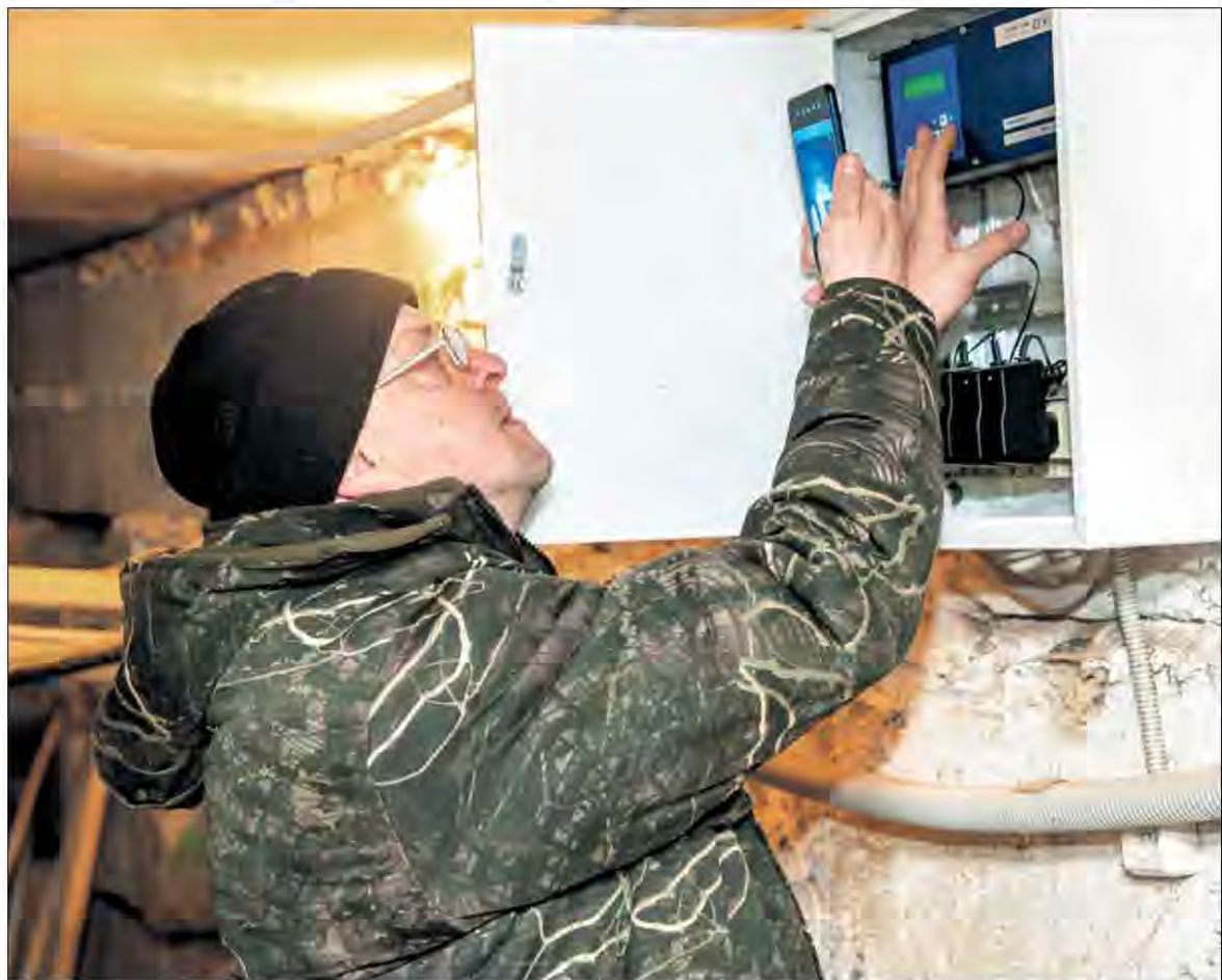
Сколько тепла потребили?

— В каждом конкретном случае управляющей и ресурсоснабжающей организациям необходимо разбираться отдельно, чтобы выявить причину перерасхода. Возможно, в этот период выходил из строя прибор учёта тепловой энергии на многоквартирном доме, были другие причины. Нюансов может быть множество. Как