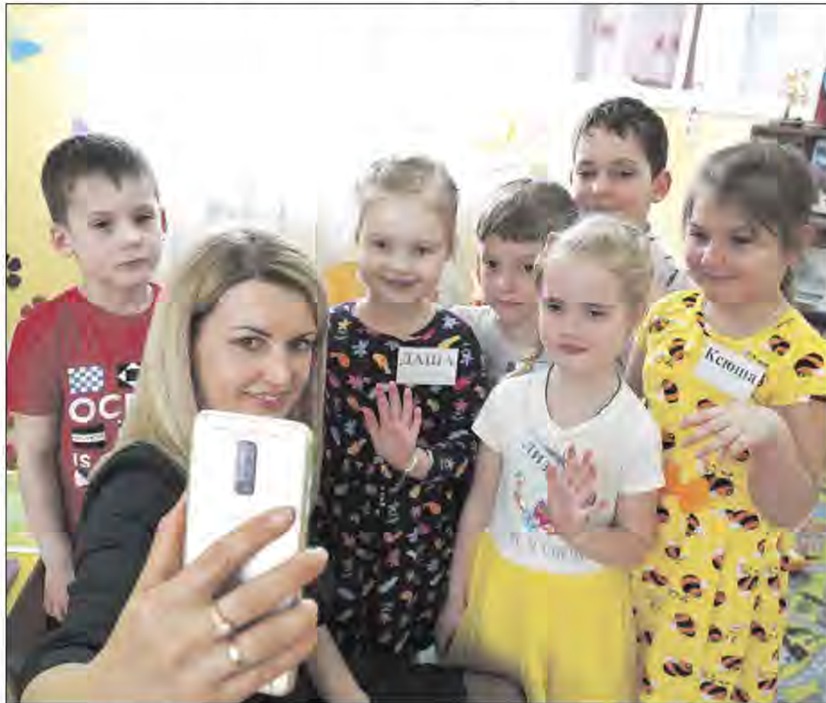
Видеозвонок отсутствующему на занятии ребёнку.

Заданиями от сказочных героев стали игры-головоломки. Практический этап состоял из поиска решений. У каждого задания — несколько вариантов