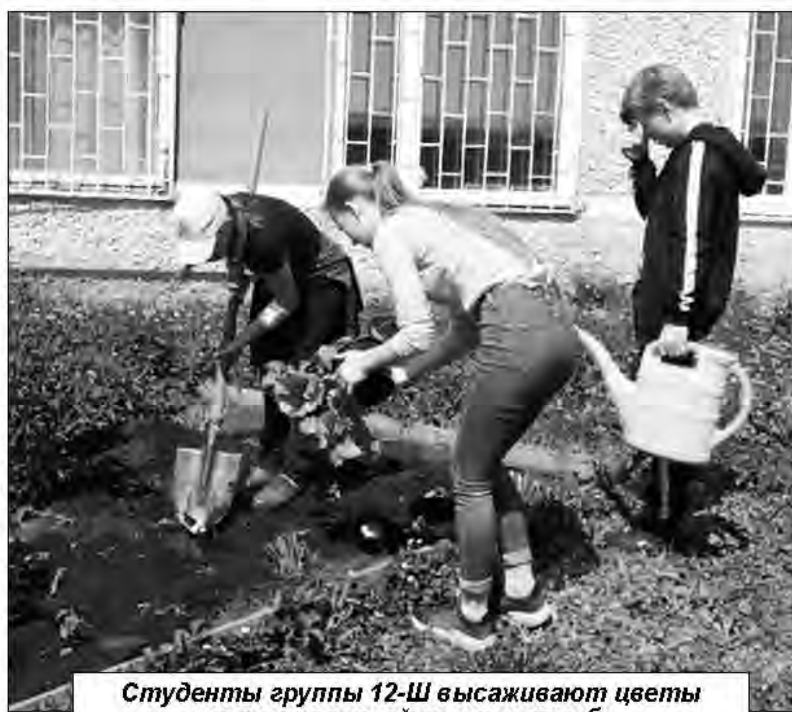
Студенты группы 12-Ш высаживают цветы на закрепленной за ними клумбе.