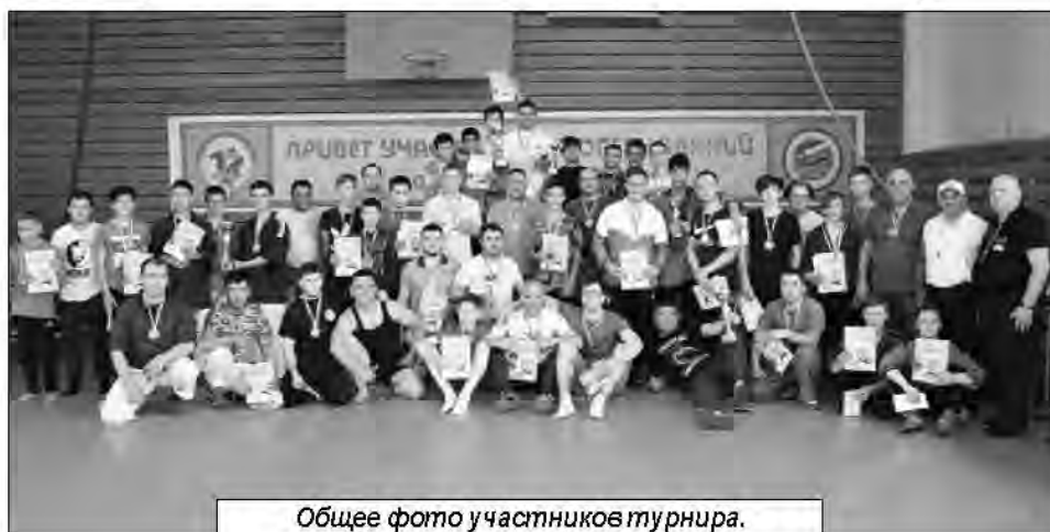
Общее фото участников турнира.