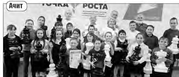
Участники шахматно-шашечного турнира, посвященного 60-летию первого полета человека в Космос.

В первичной организации ветеранов, пенсионеров пгт. Ачит ведется активная работа. Сложная обстановка была в прошлом году, многое, что планировалось, не сумели провести. Но даже в условиях ограничений работа продолжалась. Многие в онлайн-формате, дистанционно. Честно скажу, скучать нам не приходится.