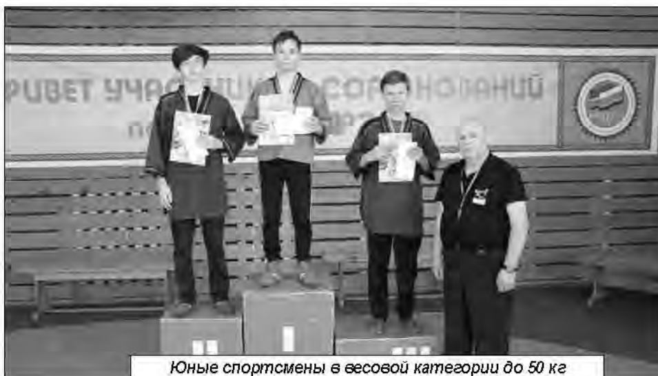
Юные спортсмены в весовой категории до 50 кг из Ачитского ГО заняли весь пьедестал!

Несмотря на пропущенный соревновательный сезон 2020 года, ачитские спортсмены показали прекрасные результаты и заняли многие призовые места.