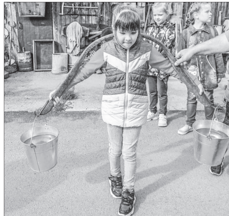
Легко ли натаскать воду коромыслом – можно проверить самим!