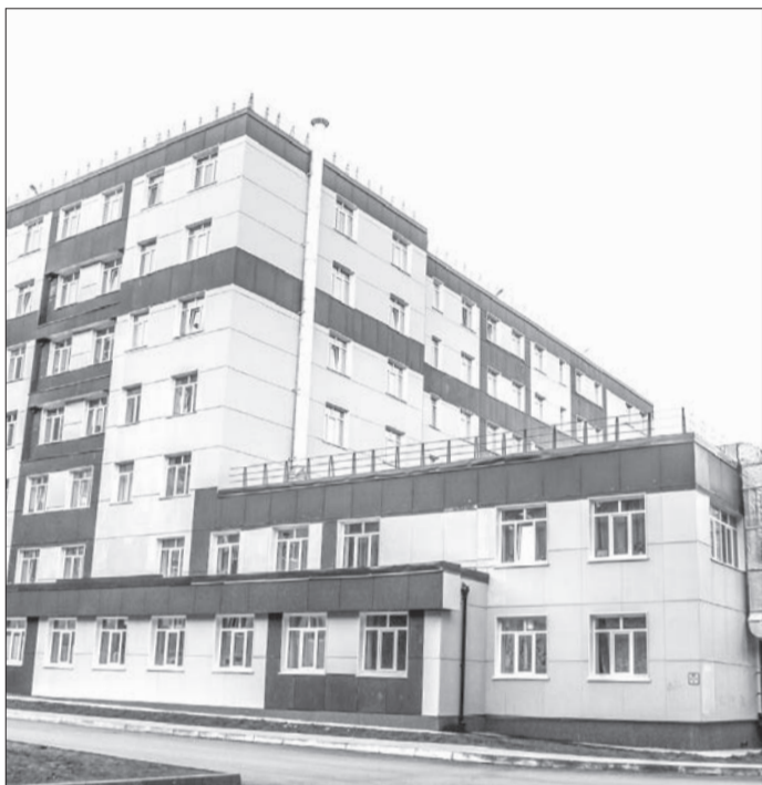
Первую очередь дома по улице Герцена, 40а в Добрянке заселили пять лет назад.