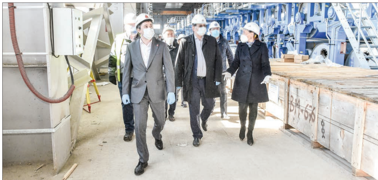
Агитационный материал Дмитрия Николаевича Махонина, кандидата в губернаторы Пермского края, размещенный на платной основе, оплачен из избирательного фонда кандидата Дмитрия Николаевича Махонина.