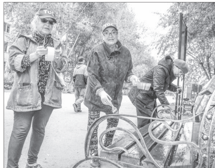
Активисты ТОС четвёртого микрорайона Добрянки несколько лет шефствуют над «Алеей доброты».