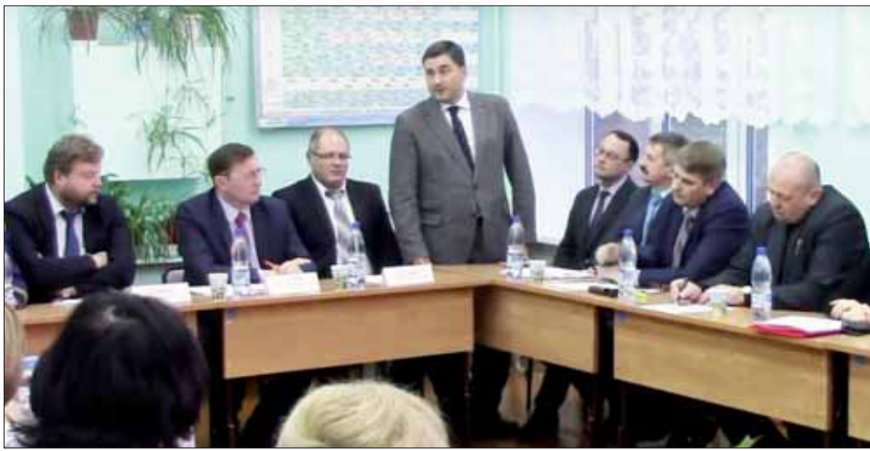
Окончание, начало на стр. 1

Сегодня в обществе ощущается явная потребность в формировании понятных, всеми признанных ценностей, способных сплотить людей разных возрастов, профессий, социальных статусов, политических взглядов. Поэтому ключевую роль должно занять единство российского народа, патриотизм, гражданственность.