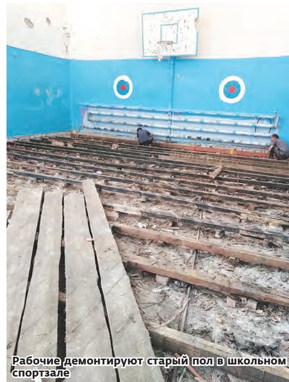
Рабочие демонтируют старый пол в школьном спортзале

ходом ремонтных работ и ответственным отношением строительной бригады к выполнению договора подряда.