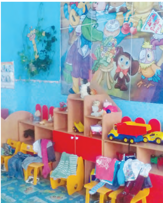
После косметического ремонта в группах Тиминского детского сада «Улыбка» стало еще уютнее и краше