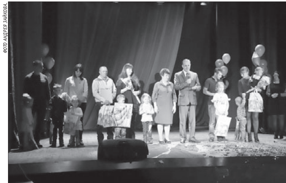
27 марта 2019 года ещё три семьи района получили поддержку на улучшение жилищных условий.

зание государственной поддержки гражданам в обеспечении жильём и оплате жилищно-коммунальных услуг», государственной программы Российской Федерации «Обеспечение доступным и комфортным жильём и коммунальными услугами граждан России», и сегодня вы получаете поддержку из бюджетов трёх уровней в сумме более трёх миллионов рублей. Это хорошее подспорье, чтобы семья могла определить своё постоянное место жительства.