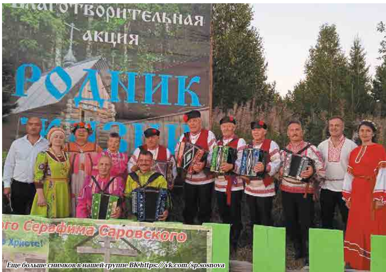
Еще больше снимков в нашей группе ВК https://vk.com/sp.sosnova

Первый фестиваль крестьянской культуры прошел в Тараканово