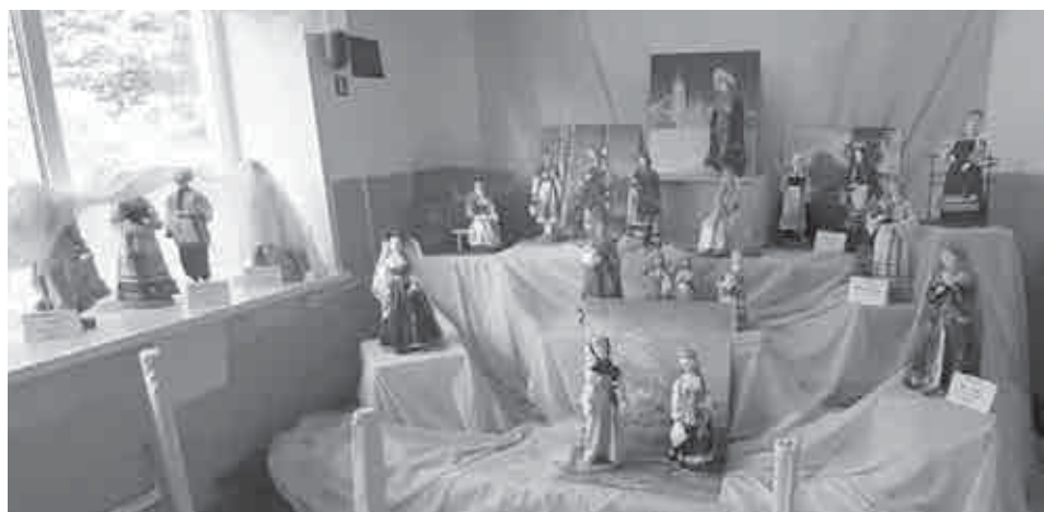
Коллекция кукол из полимерной глины мастера Евдокии Алексеевны Левиной из Лёвино.

В экспозиции, размещённой в доме культуры, представлен быт жителей села конца XIX – начала XX века. Всевозможной утварью наполнен печной угол. Тут вам и шкаф-горка с различными нужными в хозяйстве вещицами, и главные «друзья» печки-кормилицы – ухват, кочерга, капельник, и разнообразие дачковинные с точки зрения современного (особенно городского) жителя вещицы. Сложно человеку XXI века понять, зачем в хлебной чаше-чаруше «дырка» в центре и как мастер смог сплести её из елового корня, почему у русской печи внизу отверстие, и отчего изба могла именоваться «пряхой» или «непряхой». Богато обставлена и центральная часть. На стене часы-ходики, зеркало в резной раме, на кровати строчёный подзор, пышные подушки в вышитых наволочках, а взбитая перина так и манит «плюхнуться» на неё, с разбега как в детстве... Хозяйка занята прядением, но в любой момент готова укачать проснувшегося в зыбке малыша. На столе пузатый медный самовар «подмигивает» своему собрату, стоящему на шкафу и как бы говорит: «Сегодня моя очередь хозяев чайком баловать!» Один солиднее другого угольные утюги «остывают» на подоконнике. Там же бубенчик, который хозяин дома понёс