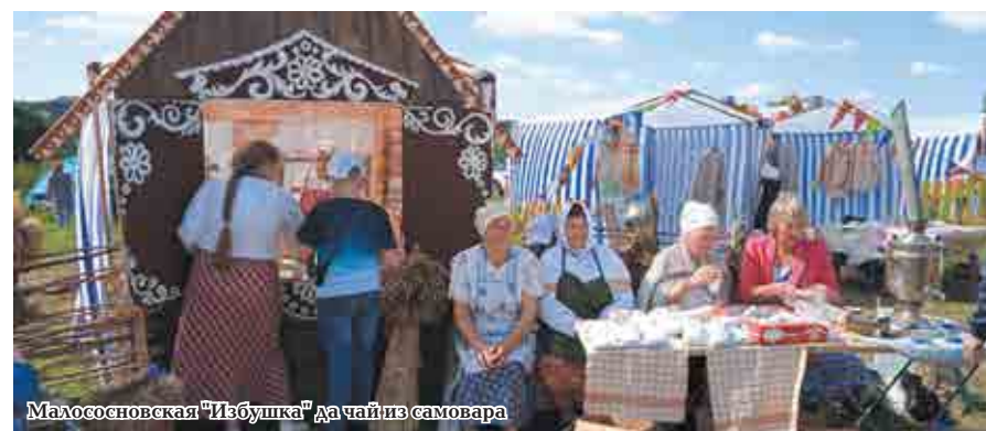
Малососновская "Избушка" дачай из самовара