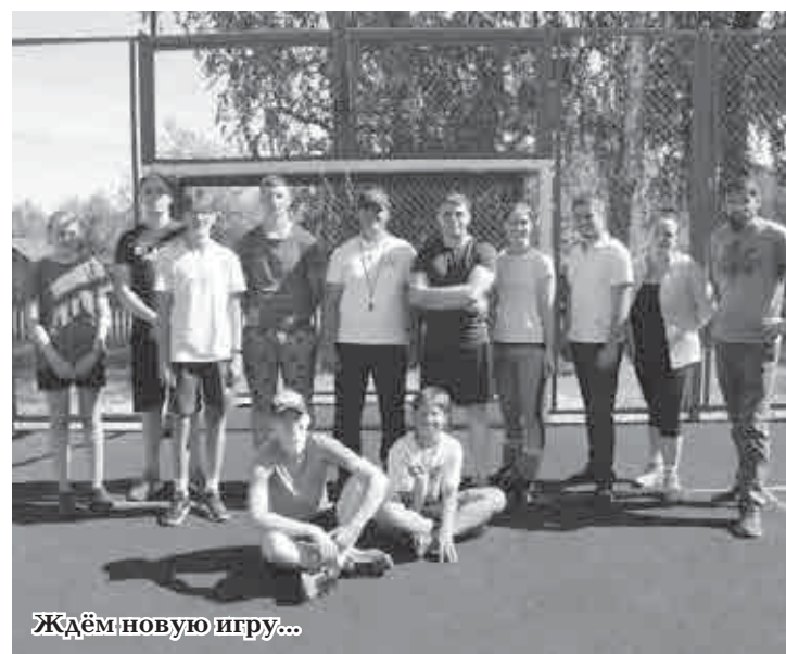
Ждём новую игру...