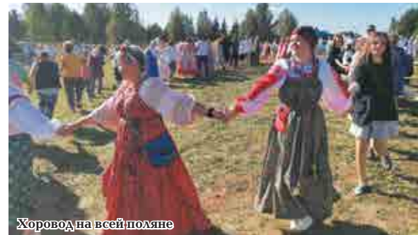
Хоровод на всей поляне

В чем оно, обаяние провинции? В неспешном течении жизни, утренних зорьках, широких, во весь горизонт закатах, в шуме дождя и градных полянах. В традиции и культуре, которая впитана с молоком матери, в сельском храме и добрососедских отношениях, в песнях и угощении на столе, краюхе горячего хлеба из печи и холодной ключевой воде, в народных костюмах и изделиях мастеров, в труде и веселом гулянии... Поэтому фестиваль «Обаятельная провинция» объединил в себе практически все сферы жизни крестьянского быта именно нашей территории.