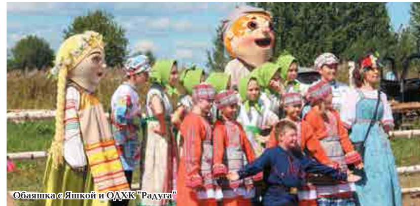
Обаяшка с Яшкой и ОДХК "Радуга"