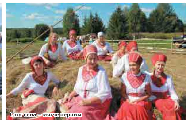
Стог сена – мягче перины