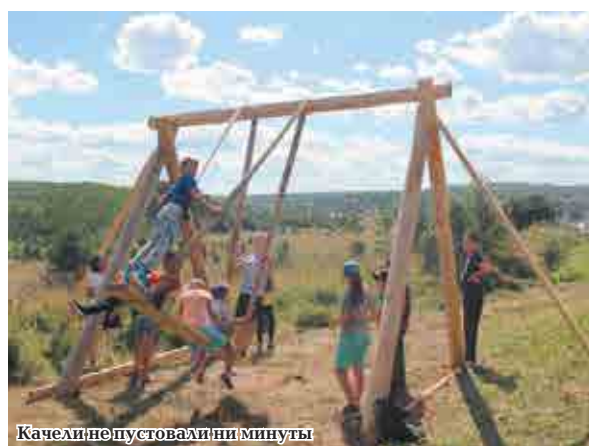
Качели не пустовали ни минуты

Светлана ЗЯМАЛДИНОВА видео Сергея БОЛОТНОВА