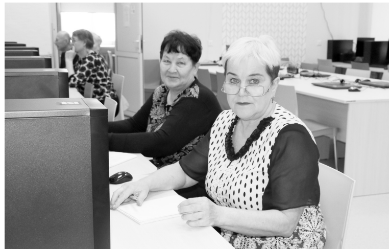
|| Жительницы Приисетья освоили компьютер.

Многим творческим людям хочется знать больше о возможностях текстового редактора. Ведь появилась возможность записать свои мысли не только на листе бумаги, но и в электронном виде. Этот файл может быть распечатан, отправлен в любой уголок мира. А как это сделать, разбирали на уроке, посвящённом Интернету. Интернетовало пенсионеров и что