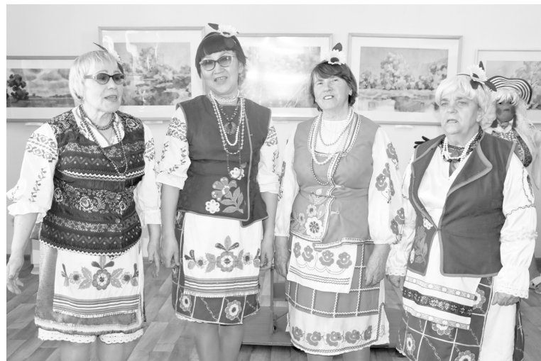
|| Украинские песни исполнили жительницы с.Верхнебешкиль.

Этим словам столько лет, и они так нужны сейчас, в настоящем времени. За освобождение Украины бок о бок сра-