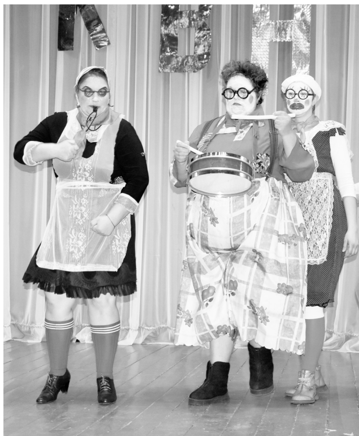
|| Команда «Клавы» играла в пионеров.

В конкурсе капитанов лидеры команд восхваляли свои