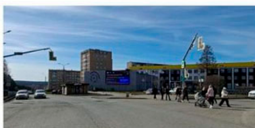
пр. Космонавтов, 1 (на фасаде)