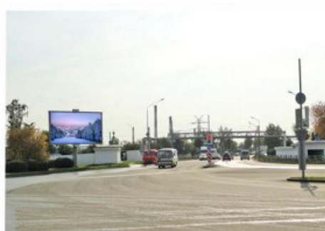
ул. Ленина - пр. Ильича - ул. Вайнера