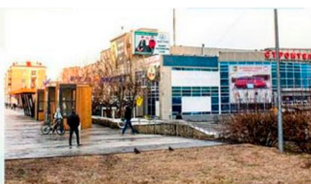
пр. Ильича, ТЦ Строитель