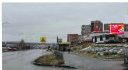
ул. Ленина, 8, ТЦ КиТ