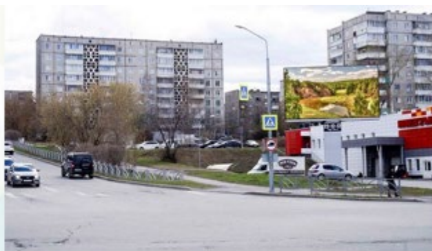
ул. Ленина - пр. Космонавтов